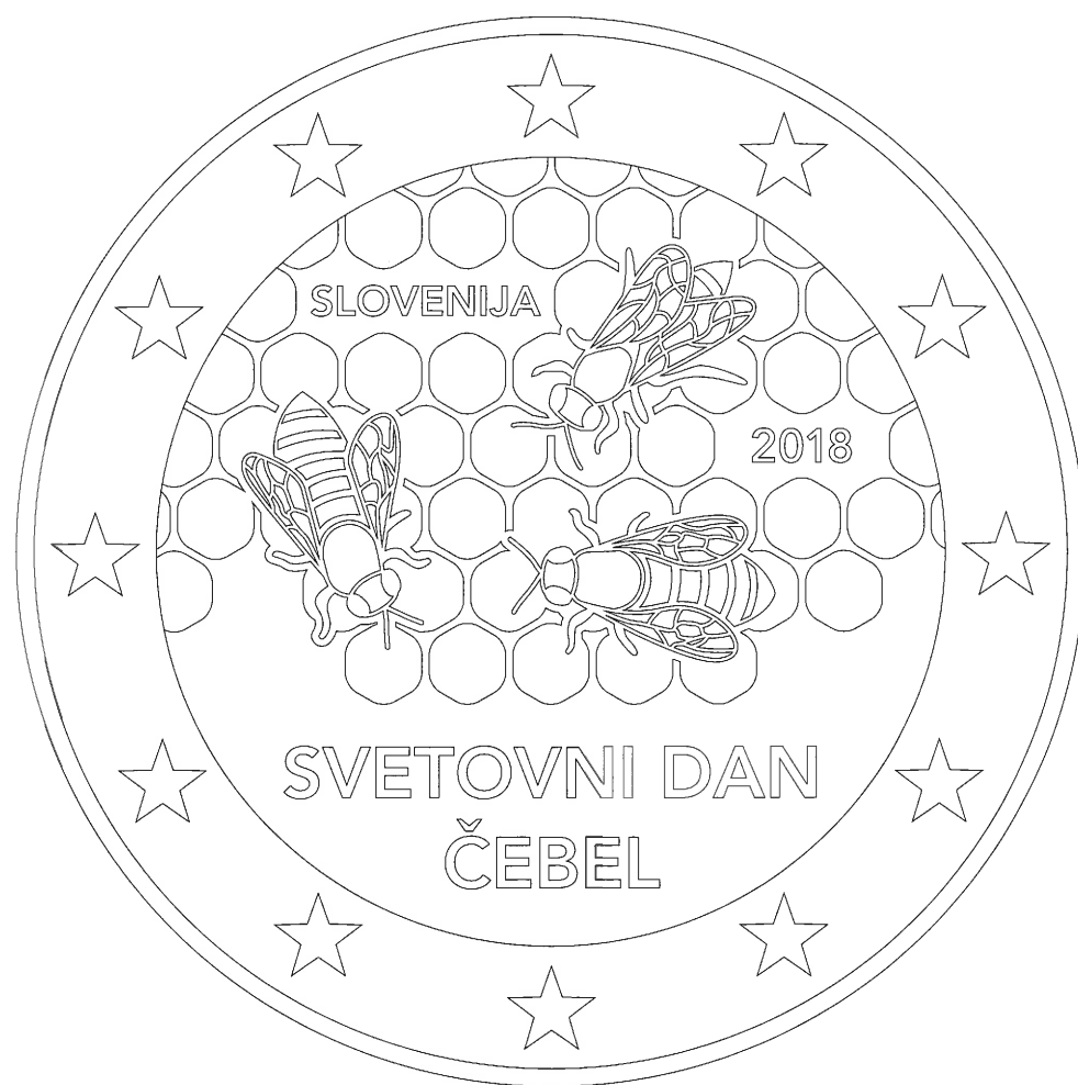
ČRTNA RISBA (M 5:1, 1:1)