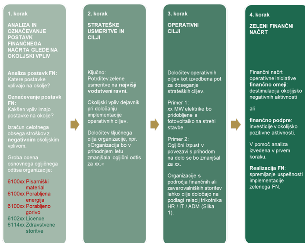
Slika 2: Grafični prikaz modela implementacije zelenega finančnega načrta

Zakaj torej zeleni finančni načrt? To orodje ima pri uvajanju bolj zelenega poslovanja najmanjše dodatne stroške, finančni načrt je splošno poznano orodje utirjanja delovanja organizacije, učinki omejevanja so neposredni in zato bolj učinkoviti.