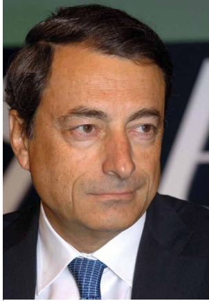
Mario Draghi Predsednik Evropskega odbora za sistemska tveganja

Z veseljem vam predstavljam drugo letno poročilo Evropskega odbora za sistemska tveganja (ESRB) – neodvisnega organa Evropske unije, pristojnega za makrobonitetni nadzor finančnega sistema v EU, kateremu ECB zagotavlja sekretariat ter nudi analitično, statistično, logistično in administrativno podporo. V poročilu je natančno predstavljeno delo ESRB v drugem letu njegovega delovanja, v katerem so potekale številne dejavnosti za vzpostavitev trdnega makrobonitetnega okvira v celotni EU, hkrati pa je odbor analiziral sistemska tveganja v finančnem sistemu EU in sprejemal ukrepe za njihovo blažitev.